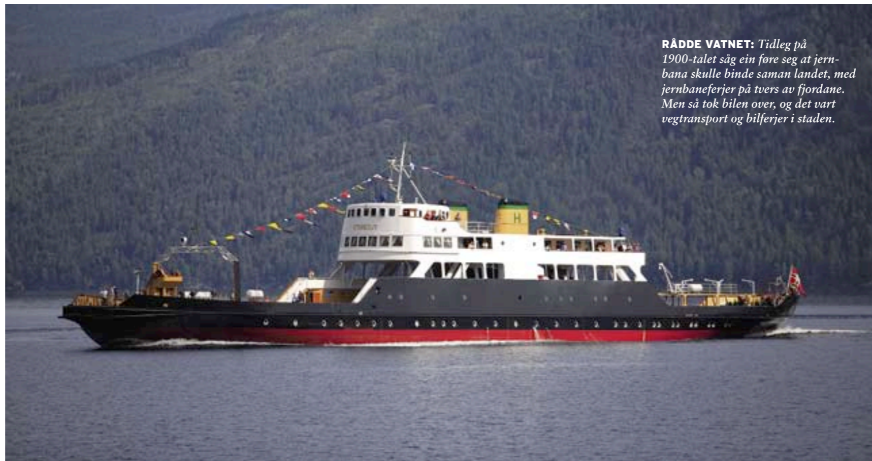
RÅDDE VATNET: Tidleg på 1900-talet såg ein føre seg at jernbana skulle binde saman landet, med jernbaneferjer på tvers av fjordane. Men så tok bilen over, og det vart vegtransport og bilferjer i staden.